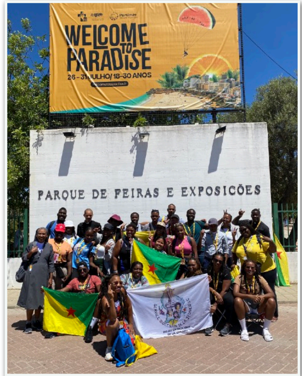
Photo de groupe