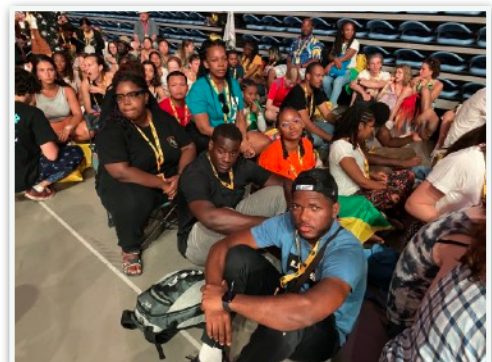
Avant l'effusion de l'Esprit Saint