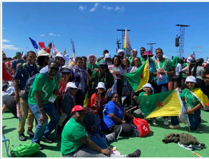
Temps des Français