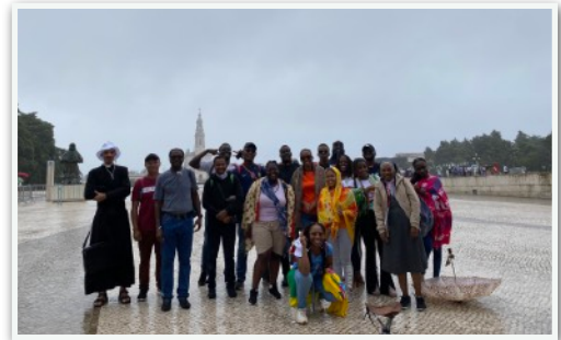
Journée à Fatima