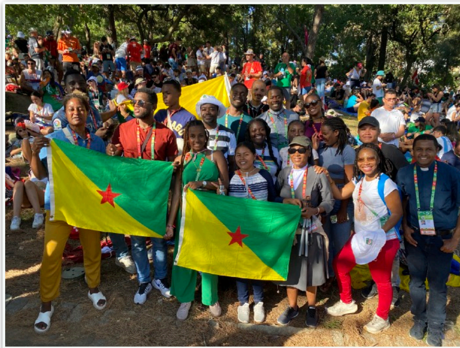
Avant le Chemin de Croix avec le Pape