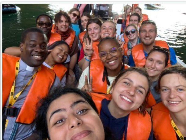
Découverte de Portimao