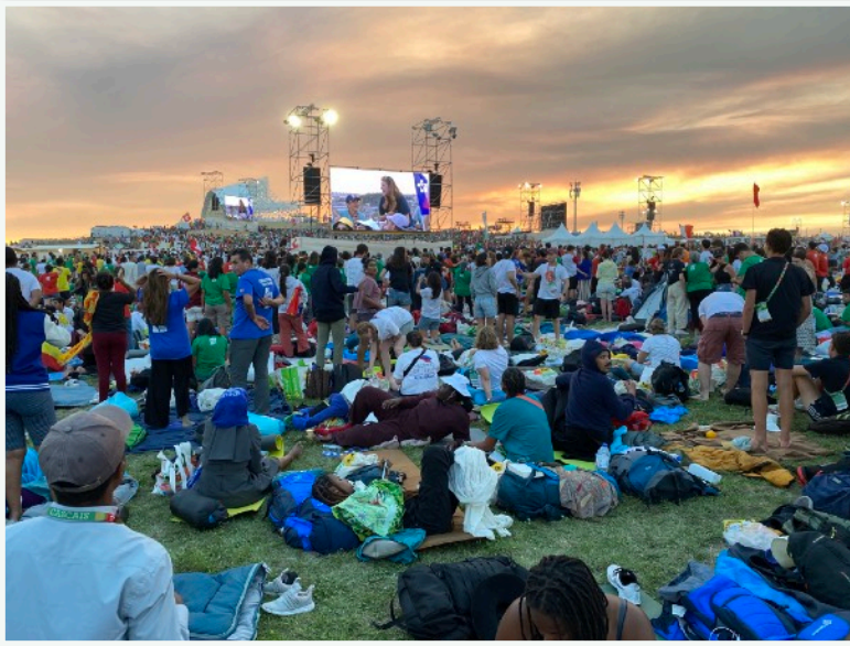
Avant la veillée avec le Pape