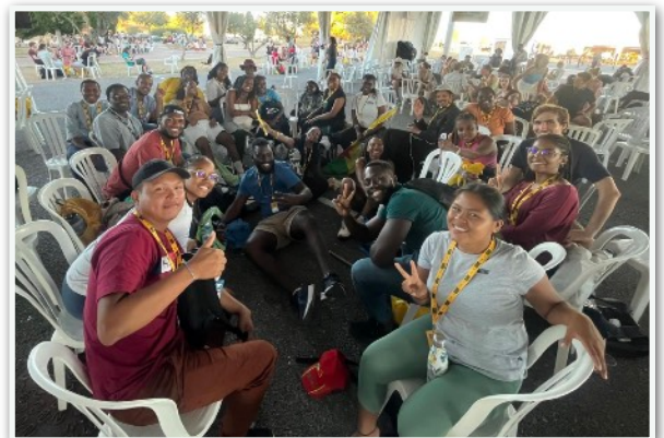
Rencontre fraternelle à Portimao