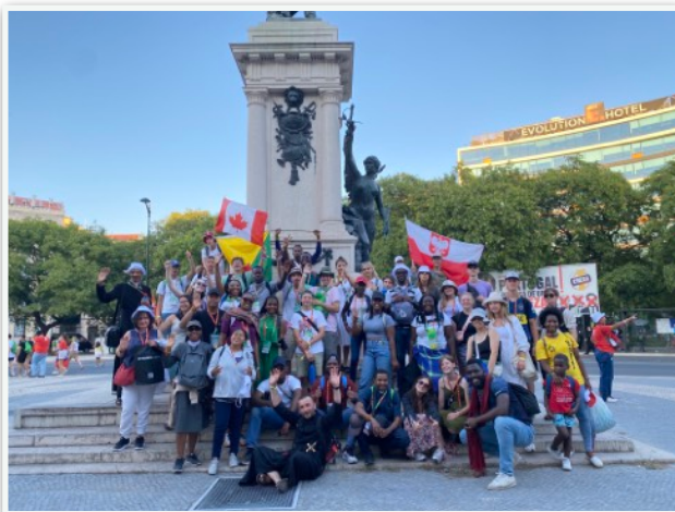
Avec les Canadiens